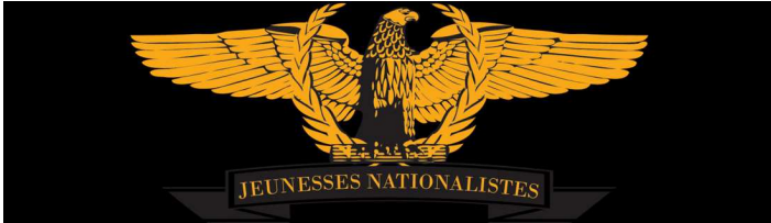
logo des JN

Le symbole des JN n'est rien de moins qu'un aigle ainsi qu'une couronne de laurier. Et détail intéressant, le volatile tient dans ses serres un faisceau ce qui laisse penser à un copier-coller à peine caché du symbole mussolinien :