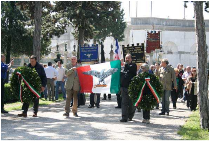
drapeau fasciste lors de la commémoration de la mort de Mussolini

Les Jeunesses Nationalistes sont à l'image de tous les groupes d'extrême droite à travers le monde, elles ne proposent comme solution aux divers problèmes sociaux que le repli sur la nation et l'exclusion de tout ce qui peut être qualifié à ses yeux d'extra-national.